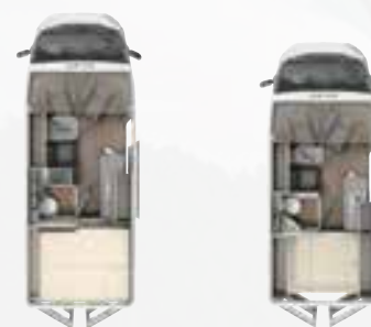
CV 600 BB CV 540 DB