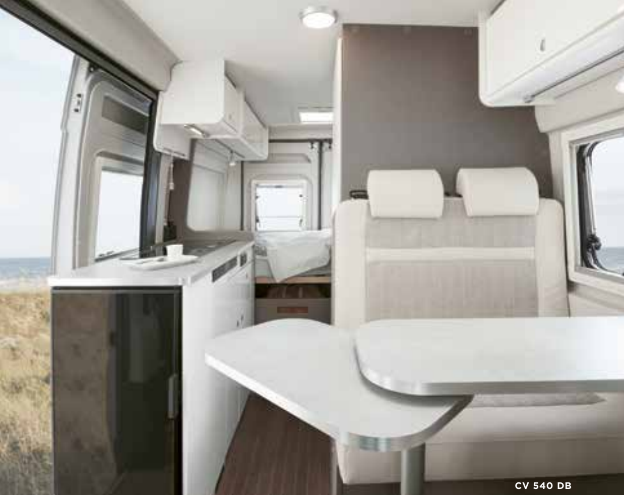
CV 540 DB