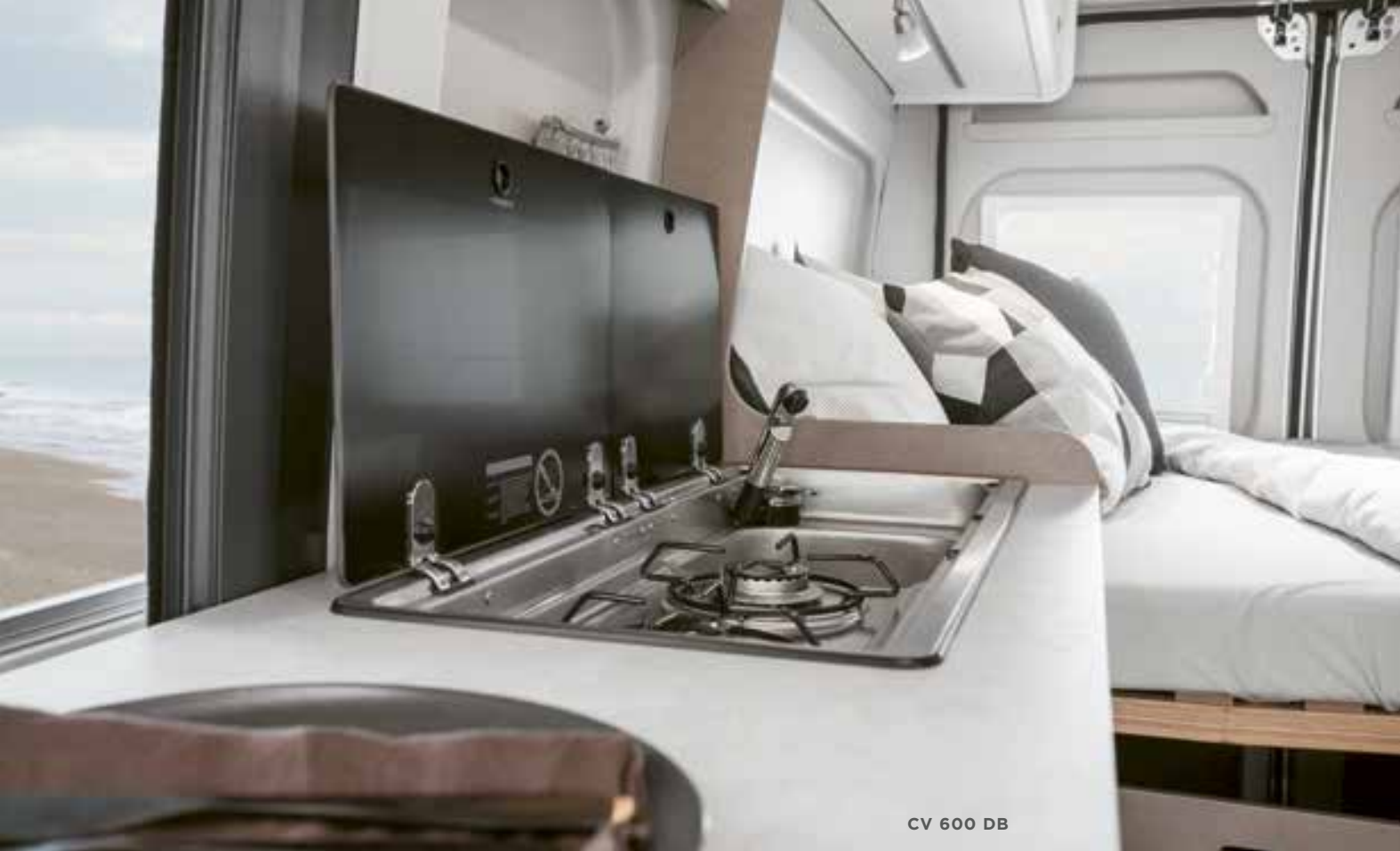
CV 600 DB