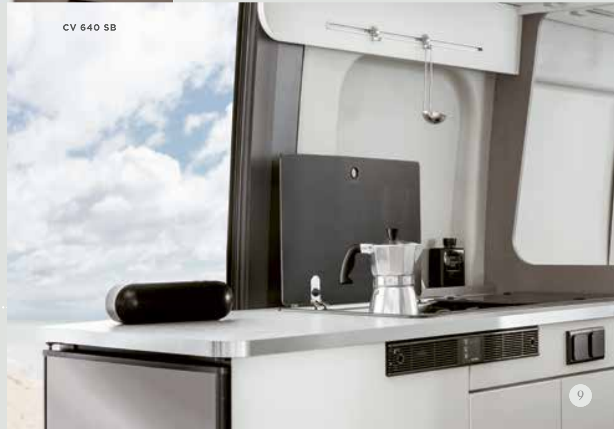
CV 640 SB

Gemeinsam genießen. Das gehört dazu. Wann immer und wo auch immer. Ein Dinner unter Sternenhimmel oder mit gekühlten Drinks auf das Leben anstoßen. Die Küche im Etrusco Campervan macht´s möglich. Und setzt noch eins drauf: Aussicht mit Fernsicht.