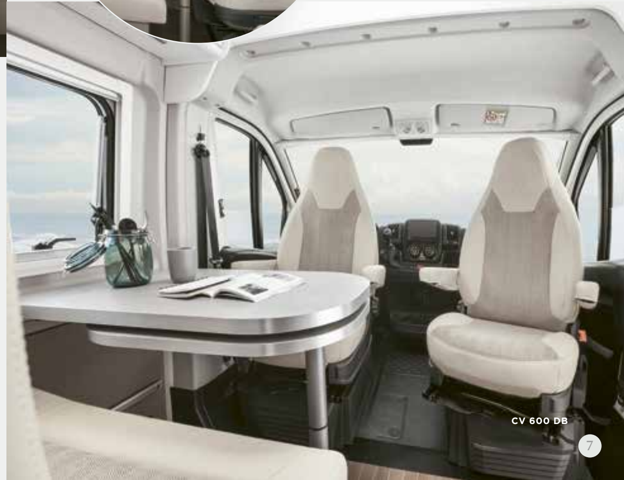
CV 600 DB

Fahrer- und Beifahrersitz um 180 Grad gedreht, den Tisch in Position gebracht und es sich schmecken lassen. Dabei freier Blick auf die wohnliche Atmosphäre und das coole Design. Einmal kurz die Zeit stoppen und innehalten.