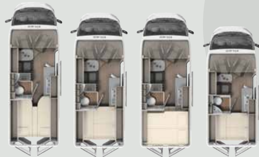
CV 640 SB